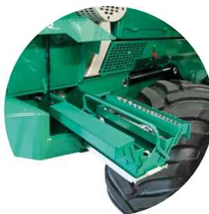
Uppvärmning av förvaringsfack och verktyg i vänster grenavvisare.