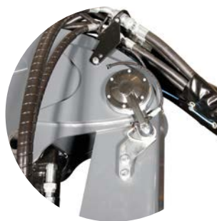
Elektronisk ändlägesdämpning (tillval)