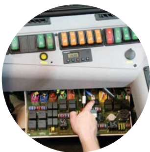
Kretskort i hytten för strömförsörjning.