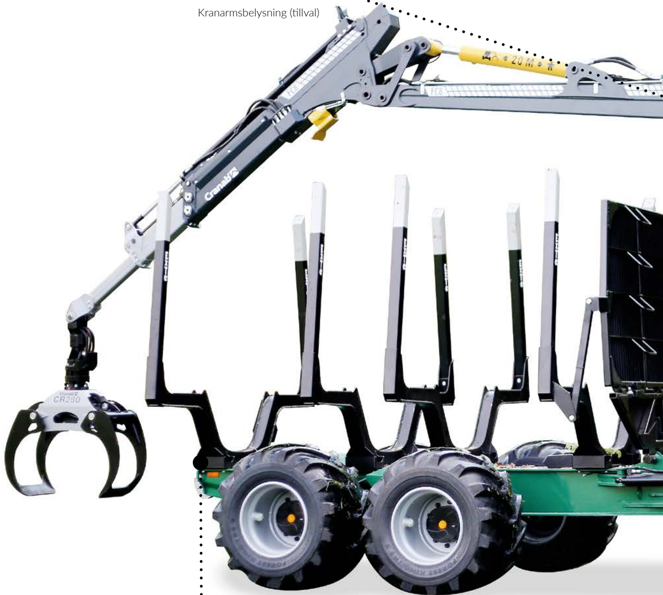
Integrerad färdbelysning i banken