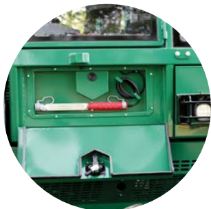
点検整備時に役立つメカニックライト