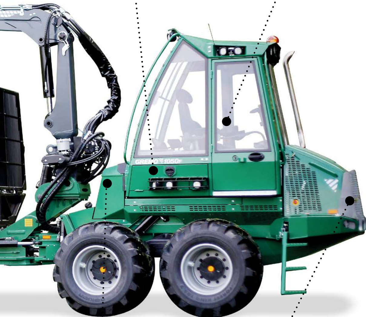
自動補充ポンプ ・ 燃料 ・ 作動油