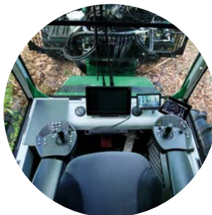
視界を遮らないキャビン